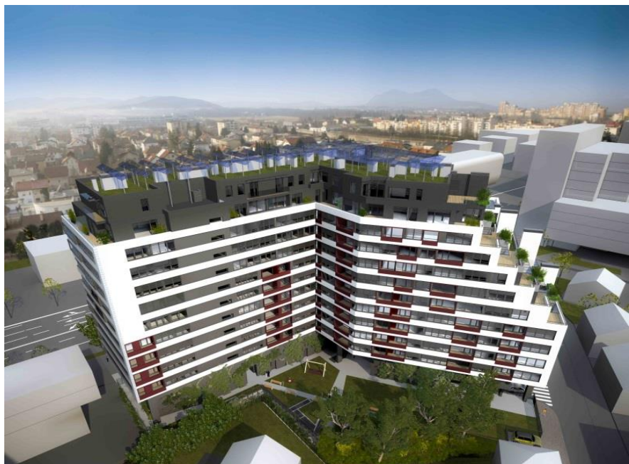
ECO SILVER HOUSE Ljubljana - 14 kWh/m 2